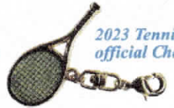
2023 Tennis Day official Charm